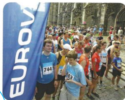
Pod křídly „EUROVIE“