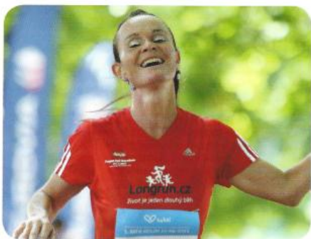
Někteří běželi s úsměvem...