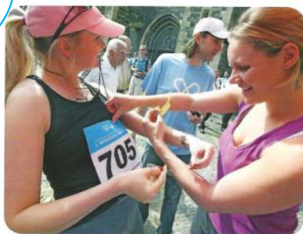
Poslední úpravy před závodem