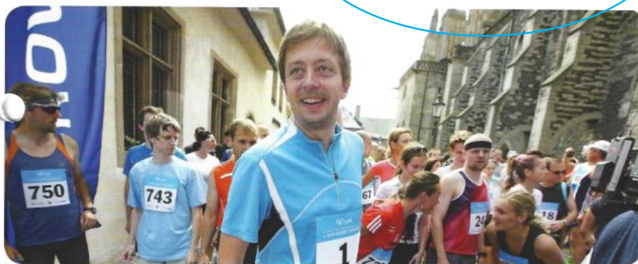
Kolínský starosta Vít Rakušan se usmívá, protože patrně ještě neví, co ho čeká...